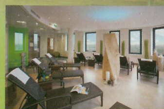
Kultiviert entspannen: Wellness mit Blick auf Wien

ein beliebter Treffpunkt für unsere Gäste wird.“